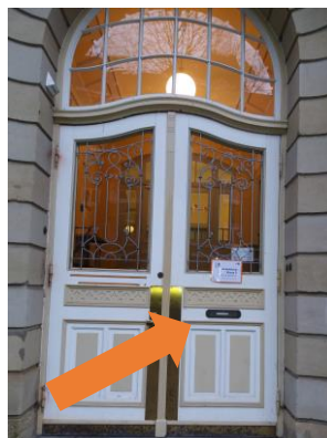
Eingang Christian-Förster- Str. 21